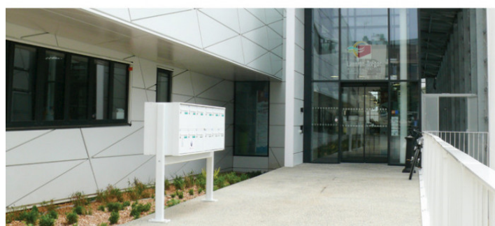
Maison de l'emploi et de la formation professionnelle, Lannion Tregor (22), ARCAU Architecte